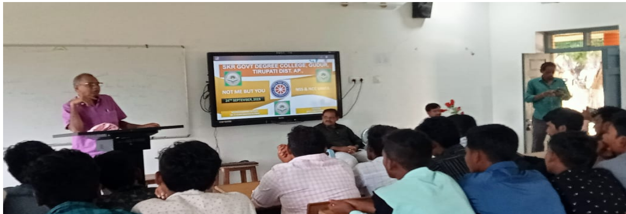
Principal Speech on NSS activities