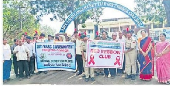
సూక్ష్మరూపేటలో ర్యాలీ చేస్తున్న విద్యార్థులు